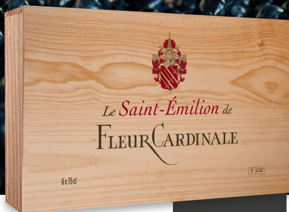
Caisse bois exclusive de 6 bouteilles à plat