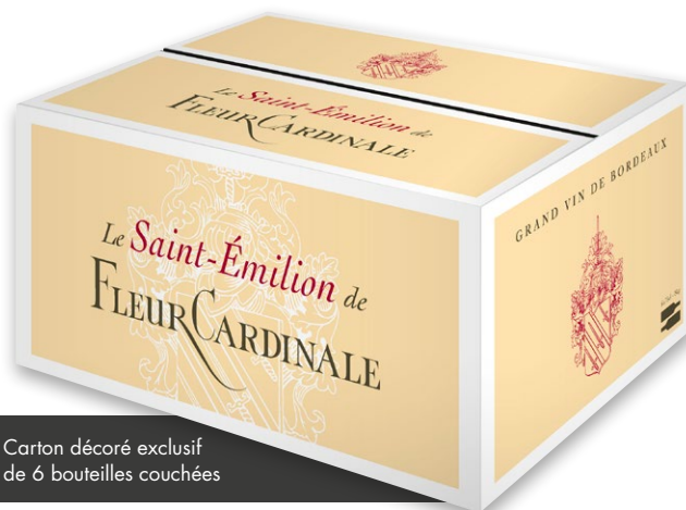
Carton décoré exclusif de 6 bouteilles couchées