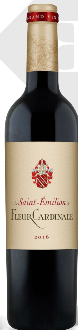
Également disponible en 50cl